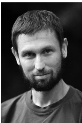
Paulo Olivier Fotógrafo Profesional