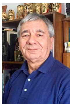
Nelson Muñoz Fotógrafo Profesional