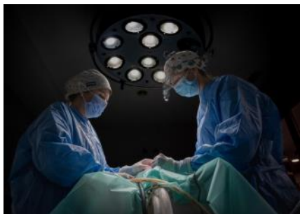
Accésit Premio Retrato sección Mujer en el siglo XXI José Raúl Pedregosa Morales El quirófano es de ellas