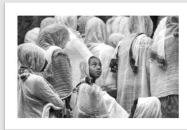
Accésit Premio Retrato 2024 sección Libre Arturo López Illana a la obra Soy diferente